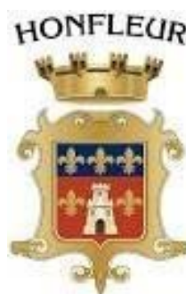
VILLE DE HONFLEUR