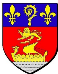
VILLE DE TOUQUES